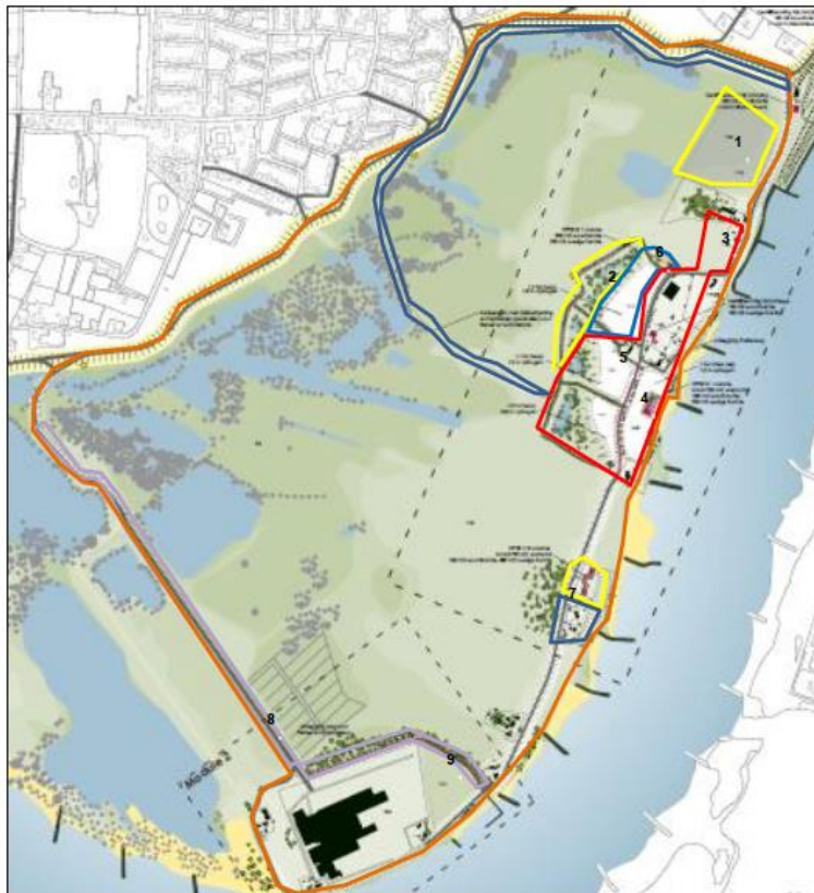
Foto: Voorbeeld van een kaart met de onderzoekslocatie. Hierin is aangegeven waar vervolgonderzoek wordt aanbevolen en waar vervolgonderzoek niet geadviseerd wordt.