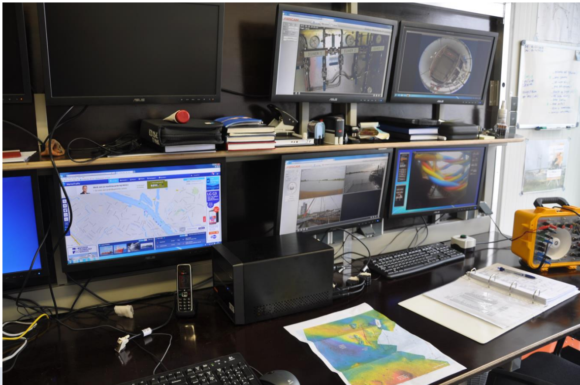
Foto: De uitkomsten van een bureauonderzoek worden gebruikt bij de uitvoering van een onderzoek waterbodems zoals hier te zien bij het onderzoek van de Kamper Kogge.